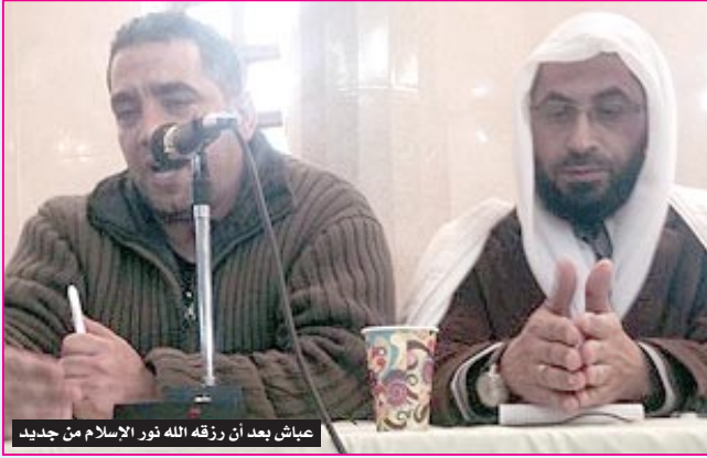
عباش بعد أن رزقه الله نور الإسلام من جديد

لخدمة الرب فيلبه هؤلاء جميع الاحتياجات على أن يكون النشاط متفقا ومثمرا.