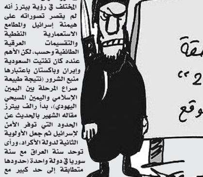
مستوعبة في بريطانيا، وأن استبداد الحكام في الدول

أحداث 11 سبتمبر - غزو أفغانستان - غزو العراق.