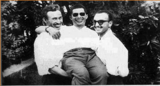
لحظات نادرة... زمن الحرب... صورة تذكارية تظهر لنا الجانب الإنساني للمجاهدين مداعبة بومدين ولطفي لبن طوبال. صيف 1959 خلال اجتماع العقلاء العشرة.

هذا ما علق به الدكتور محيي الدين عميمور، مستشار الرئيس الراحل هواري بومدين، والوزير الأسبق للثقافة على هذه الصورة المرببة من الزمن الجميل، بعد أن نشرها على صفحته الفيسبوكية..