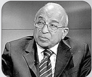
بقلم: فهمي هودي

بسبب من ذلك، أضاف بن يشاي. فإن الدور الأمريكي في الحملة العسكرية الراهنة التي يقودها السعوديون ظل محدودا جدا، ويقتصر على الجانب الاستخباري، في حين أنه كان بوسع الولايات المتحدة ان تلعب دورا أكثر قوة وأشد تأثيرا في مساعدة التحالف العربي على حسم المعركة. المعلق الاستراتيجي يوسى ميلمان كتب في صحيفة معارف (3/72)، مشيرا إلى أن التمدد الإيراني في اليمن يمثل صورة مصغرة لما يمكن ان تسفر عنه الأوضاع بعد التوقيع على الاتفاق النهائي بشأن البرنامج النووي، ويذكر أن طهران سوف توظف أي