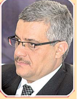
بقلم: محمد قروش

إن ما يفعله السيسي بعد الانقلاب على نظام الرئيس المنتخب محمد مرسي من طغيان وتجبر ضد الشعب المصري المسالم ومحاولة حكم البلاد عن طريق الرعب والتخويف والترهيب هو أسلوب قد أثبت فشله في كل الدول والأنظمة