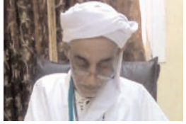
■ الشيخ أبو اسماعيل خليفة

إن من أسوأ العادات وأقبح الأفعال والتصرفات ظاهرة الفضول والتطفل على حياة الغير، وإنها دليل على الانحطاط الأخلاقي وانحسار المستوى الحضاري والثقافي سواء للأفراد والمجتمعات، وقد استفاضت النصوص الدينية بالتحذير من هذه الظاهرة السلبية وزجرت مرتكبها ونهت عنها وبيحت صاحبها.. منها قوله صلى الله عليه وسلم فيما رواه الترمذي وغيره، عن أبي هريرة رضي الله عنه: "من حسن إسلام المرء تركه ما لا يعنيه". فما أيتها الجيب: إذا أردت أن يحسن إسلامك، فاترك ما لا يعنيك من المحرمات والمشتبهات والمكروهات وفضول المباحات التي لا تحتاج إليها، واشتغل بما يعنيك من صحة اعتقادك والملذات، إنه جواد كريم.