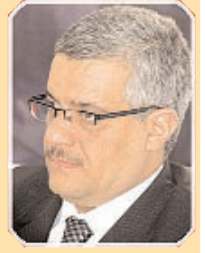
■ بقلم: الأستاذ محمد قروح