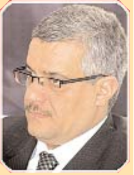
بـقلم: محمد قروش

متدهورا متناحرا ودولة مهلهلة، والأكثر من ذلك فقد ساهم في تحطيم الإنسان الجزائري عن طريق تقويض أساساته ومرجعياته الثقافية والفكرية والحضارية، وهو ما أدى إلى انهيار منظومة القيم بشكل رهيب وأنتج أجيالا لا تعتد بقيم المجتمع ولا بمكوناته الأساسية. تضاف إلى ذلك كل محاولات الهدم التي تمارسها التيارات الوافدة من وراء البحار التي أصبحت اليوم تستهدف قلوب وعقول الناس من خلال وسائل جهنمية رهيبية تهدف إلى مسخ وسلخ وتشويه الأسس والمرجعيات الفكرية والتاريخية والحضارية التي يقوم عليها المجتمع.