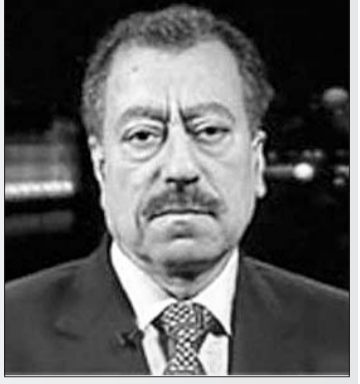
بِقلم: عبد الباري عطوان

أربعة تفجيرات تهز السعودية في يوم واحد وأخطرها في الحرم النبوي الشريف.. ما هي الرسالة التي تريد الدولة الإسلامية -إصالحها؟ وهل الهدف الأكبر هو موسم الحج -المقبل؟ وما الذي يجب على القيادة السعودية فعله؟