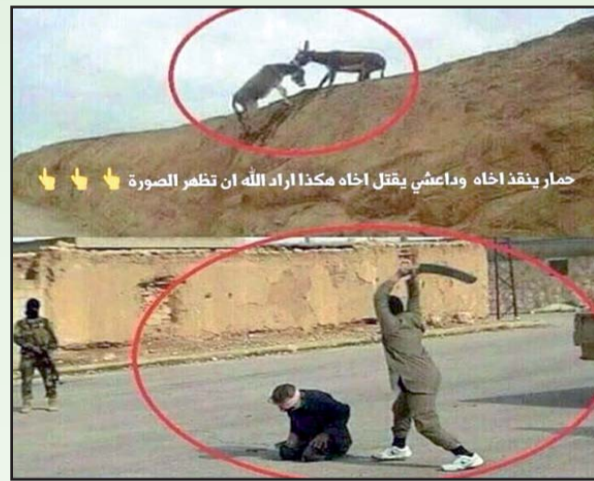
حمار ينفذ اخاه وواعشي يقتل اخاه مكذا اراد الله ان تظهر الصورة